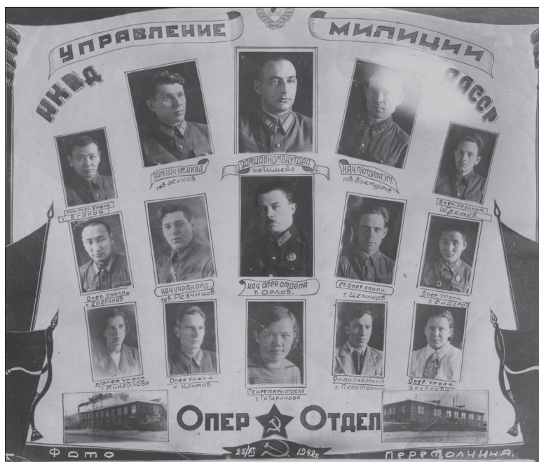
Рис. 4. Управление милиции НКВД ЯАССР. Оперотдел. 25.11.1942