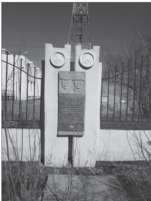
Рис. 2. Памятная стела на месте расположения здания ЯНВШ в г. Якутске.